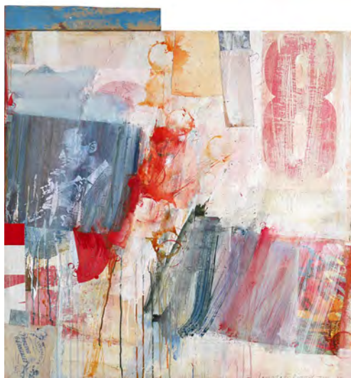
Miles Davis Free Jazz, 2000/15 Acryl, Collage, Holz auf Leinwand, 90 x 90 cm