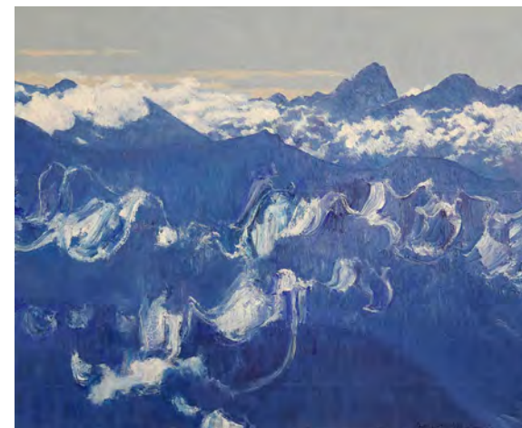
Flimser Berge mit Schleierwolken, 2016 Öl auf Leinwand, 90 x 110 cm