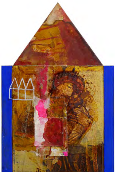
Ikone, 2016 Mischtechnik, Collage auf Holz, 44 x 29 cm